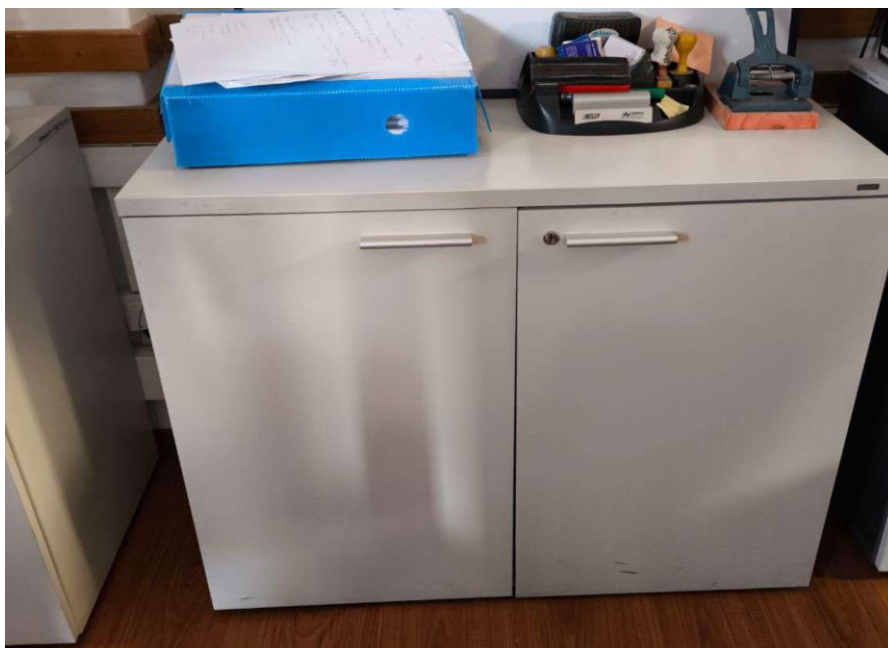
Armario con dos puertas visualizado en la SGP sin etiqueta, no identificado en la dependencia según el SIP.